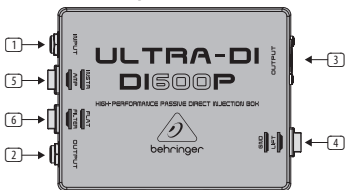
図 1: 上面部