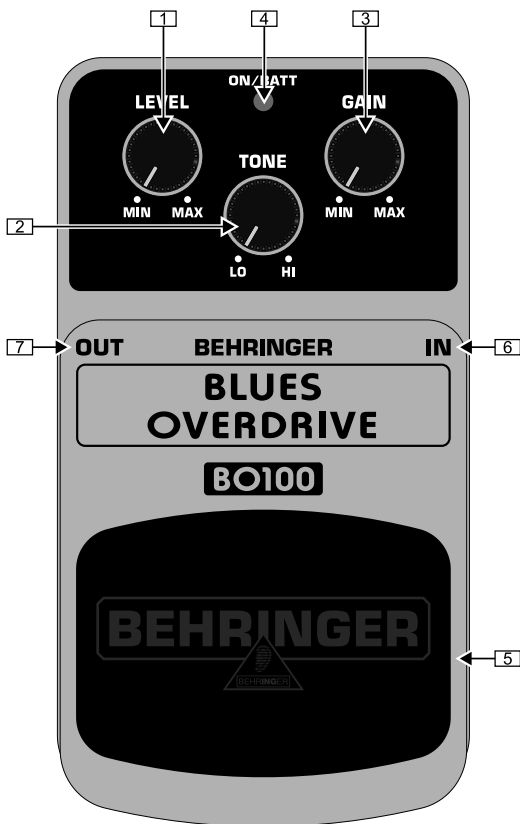
Vista lato superiore